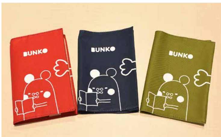
「BUNKOの文庫カバー」 詳細は文教大学HPよりご確認ください。 https://www.bunkyo.ac.jp/about/public_relations/goods/

受賞したことに伴う紀伊國屋書店特別イベントにおける販売や新聞取材など、予想外の反響を得ることができた。帆布の質感と落ち着いた色使いのブックカバーは、使うほどに良さがわかる一品となっている。足立区の企業とコラボレーションできたことにより、新キャンパス開設を盛り上げる一助となるとともに、少なからず大学ブランドを高めることができたと考えている。また、学内製作だけでは達成できなかった話題性が生まれ、今後に繋がる地域との絆づくりの端緒となったのではないだろうか。来年4月に開設される新キャンパス内や足立区内で「BUNKOの文庫カバー」をつけて読書している人を多く目にするのがとても楽しみである。