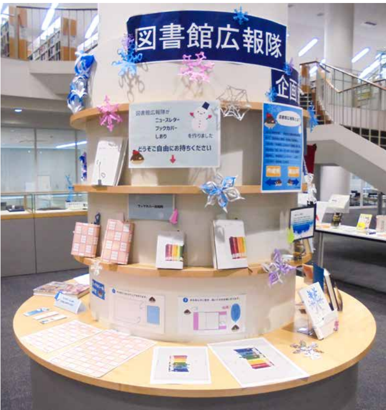
展示イベントの様子

コロナ禍が収束しても、以前とは異なった形でのサービスが図書館には求められよう。そうした制約的環境において、図書館運営に携わる教職員は、学生主体の協働施策が円滑に実施され、学生に何らかの経験を体得してもらえるよう支援を重ねていきたいと考えている。こうした小さな歩みが、やがては身近な図書館につながることを切に願うばかりである。