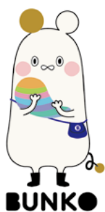
文教大学 公式マスコットキャラクター

ブックカバーは完成後、2019年秋から大学の購買部で販売している。紺・カーキ・赤の3色があり、売上も順調に推移している。他にも、卒業生が芥川賞・直木賞を2018年に続けて