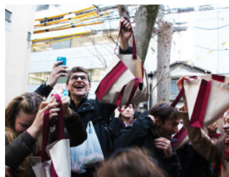
[写真2] 豆まき体験で大興奮する外国人の参加者