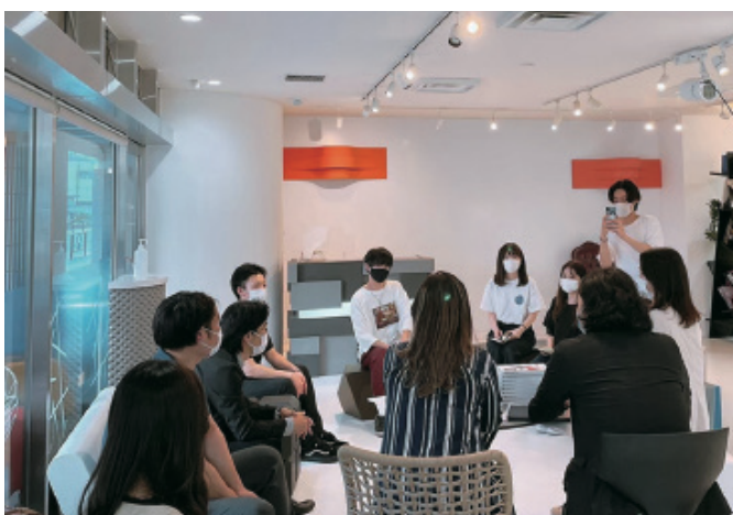
[写真5] (株)SIXINCH.ジャパンと学生の打合せ

マーケティングを実践した。学生らはマーケティング企画をいくつも練り上げ、精緻化し約90万円の予算と寄付金を獲得した。その後、企画を実現する上で、ポスターやランディングページ、Instagramのsixinch家具の写真の投稿をし続け、また同社の家具が設置される全国の施設に協力の要請を行う営業活動も展開した。協力企業は11社にもなり、それぞれに計画支援を依頼した。ポスター提案は、200以上がポツになり、またインフルエンサーとの交渉をしながら炎上対策も入念に行い、ターゲットへの認知拡大を狙った。その結果、認知