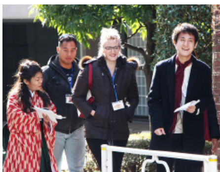
[写真4] 英語を話す機会のない学生が颯爽とガイドする

これを継続し続ける大変さを理解した」という。また外国人を集客するために、ホテルに営業をかけ、協力を依頼した。ビジネスメールも書いた経験のない学生がアポイントを取ることは大変緊張するものであり、教科書で述べられる「営業」の文字以上の重みを感じていた。同時に、「営業活動で沢山の