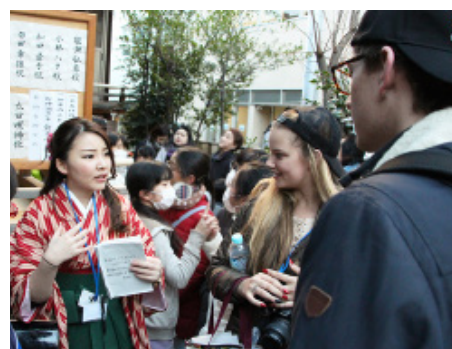
[写真1] 日本の行事について説明する学生

学生たちは、マーケティング理論をベースとした戦略計画と工程管理としてのプロジェクトマネジメント理論を使った。ターゲット設定やコンセプト設計、きめ細かな当日準備をはじめ、神社や商店への協力依頼や、Facebookでの英語の告知広告出稿、ホテルへの集客に向けた営業活動も行った。特に学生たちは、SNSを使った広告出稿やその制作に戸惑ったが、広告の華やかな面だけでなく広告の審査や権利までも関与し、管理プロセスのような実務の裏側も重要であることを理解した。ある学生はこんな感想を漏らした。「テストでは、簡単にSNSを活用した施策を行うなどの解答をしがちだが、実際にやってみてその課題の多さを知った。ビジネスでは