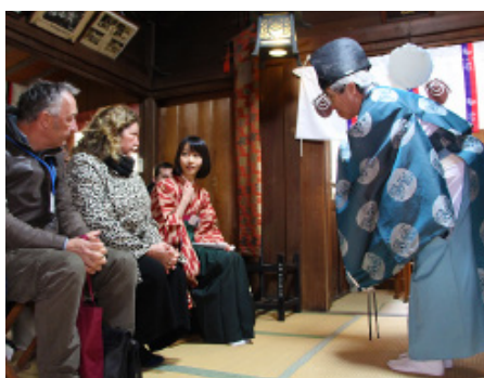
[写真3] 神社でお祓い体験